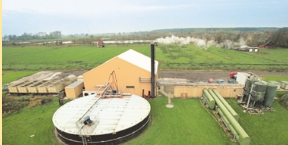
Usine de biogaz au Schleswig-Holstein, Allemagne

Les délégués ayant droit à une aide financière pourront se faire rembourser leurs frais de déplacement sur présentation du billet original pris dans l'aéroport le plus proche de leur domicile pour un vol à Cologne/Bonn, Düsseldorf, Francfort/Main et recevront leurs indemnités journalières à leur arrivée à Bonn, au secrétariat de la conférence.