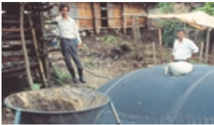
Production de biogaz sur une plantation de thé en Inde

Les services énergétiques sont indispensables au bien-être de l'homme et leur disponibilité pose une importante condition préalable au développement social et économique. Toutefois, la plupart des économies reposent sur une utilisation inefficace de l'énergie en grande partie fournie par des combustibles fossiles. Aujourd'hui, la filière énergétique mondiale n'est pas viable sur le plan économique, social et écologique. La grande question est de savoir comment passer, à l'échelle mondiale, à une filière énergétique durable de manière active et opportune, tout en permettant le développement social et économique des pays industrialisés et des pays en développement. Les énergies renouvelables peuvent grandement contribuer à relever ce défi.