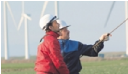
« Repowering » au Schleswig-Holstein, Allemagne