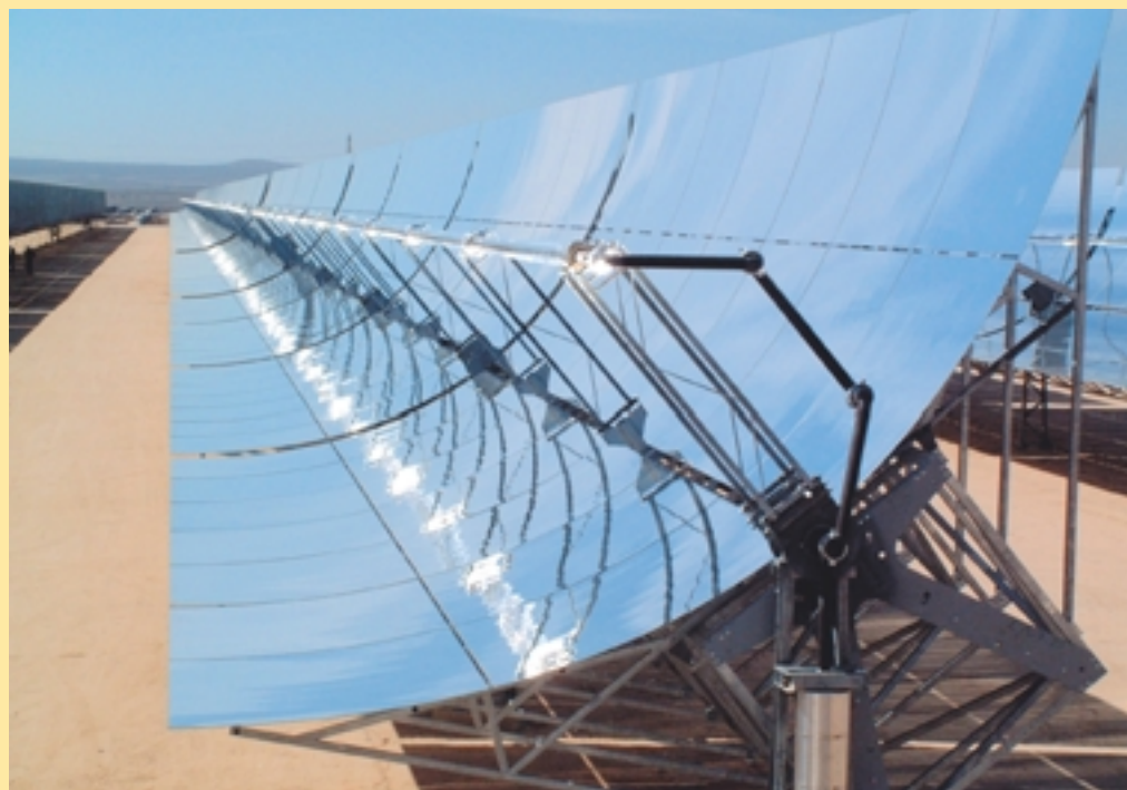
Grande centrale héliothermique utilisant la technologie à base de miroirs paraboliques, Espagne

En poursuivant ces objectifs, la conférence répond à l'appel du Sommet mondial de Johannesburg pour le développement durable (voir encadré). Elle contribuera également à maintenir la dynamique créée par la coalition de pays partageant les mêmes opinions sur la promotion des énergies renouvelables (la Coalition de Johannesburg pour les énergies renouvelables), conformément à leur déclaration commune, «The Way Forward on Renewable Energy».