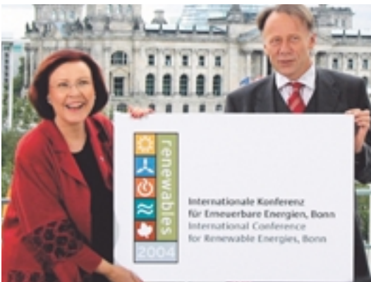
Heidemarie Wieczorek-Zeul et Jürgen Trittin