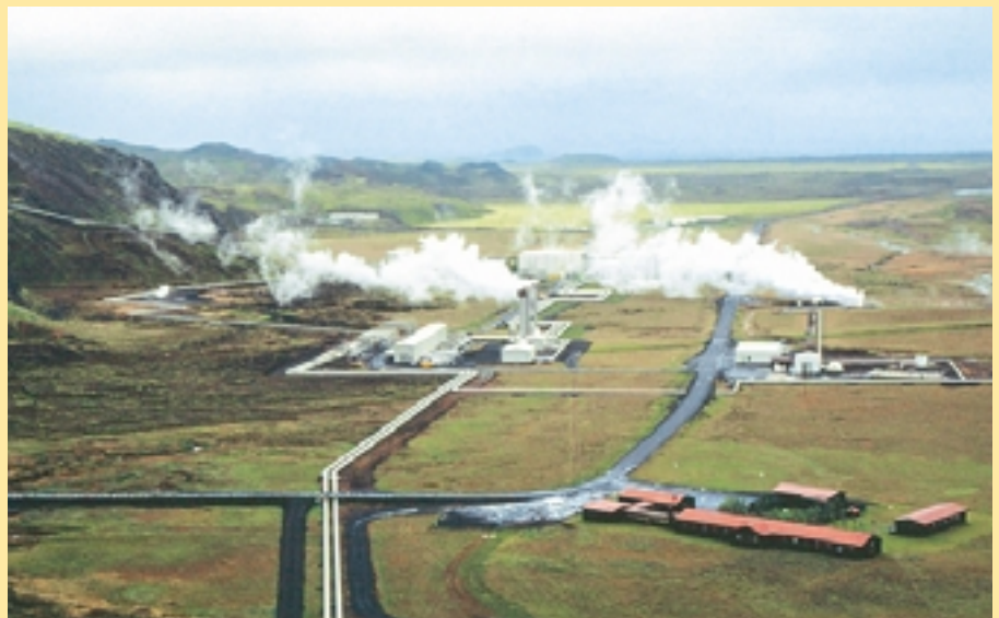
Centrale géothermique en Islande

Le gouvernement de la République fédérale d'Allemagne a invité les Nations unies et d'autres organisations internationales à participer, au plus haut niveau, à la conférence. Le programme provisoire de la conférence, les informations techniques à l'intention des participants et les formulaires d'inscription ont été envoyés au plus tard à la fin de janvier 2004 . On peut s'en procurer des exemplaires supplémentaires auprès du secrétariat de la conférence et des ambassades/représentations permanentes d'Allemagne. Il est demandé aux organisations participantes de bien vouloir faire parvenir une liste de délégués aux organisateurs de la conférence d'ici le 30 avril 2004 , par l'intermédiaire des ambassades/représentations permanentes d'Allemagne. Il est en outre demandé à chaque délégué de faire parvenir un formulaire d'inscription au bureau d'enregistrement du secrétariat de la conférence.