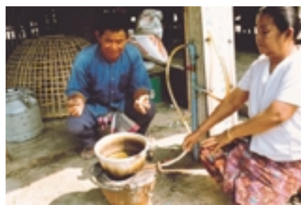
Un cuisinier népalais cuisinant au gaz méthane

Un groupe consultatif international (International Advisory Group) a été nommé pour sensibiliser les différents groupes de la société civile. Les membres de ce groupe consultatif servent de points focaux pour la préparation au DM de chaque groupe d'intérêts. La composition du groupe consultatif international reflète la diversité des intérêts, compétences et expériences des groupes d'intérêts dans le domaine des énergies renouvelables. Elle traduit également la volonté d'établir un rapport équilibré entre hommes et femmes et entre les régions géographiques. Le groupe consultatif international proposera les thèmes du DM et coordonnera les interventions.