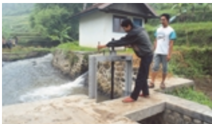
Mini centrale hydraulique pour un village indonésien dépourvu de réseau