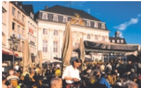
Festivités hautes en couleur sur la place du marché de Bonn