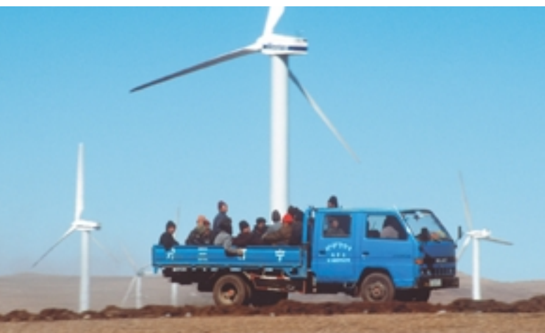
Énergie éolienne : une ressource naturelle en Mongolie intérieure

Le développement massif de marchés pertinents est une condition préalable à l'utilisation accrue des énergies renouvelables. Aujourd'hui, toutefois, ces dernières ne bénéficient pas partout du cadre stratégique favorable dont elles ont besoin pour pleinement développer leurs marchés potentiels et les risques liés à la dépendance vis-à-vis des sources d'énergie fossile ne sont pas correctement traduits en signaux du marché appropriés. Que peuvent faire les gouvernements, les organisations internationales et les groupes d'intérêts pour accélérer le développement du marché et donner aux énergies renouvelables la possibilité de lutter à armes égales ?