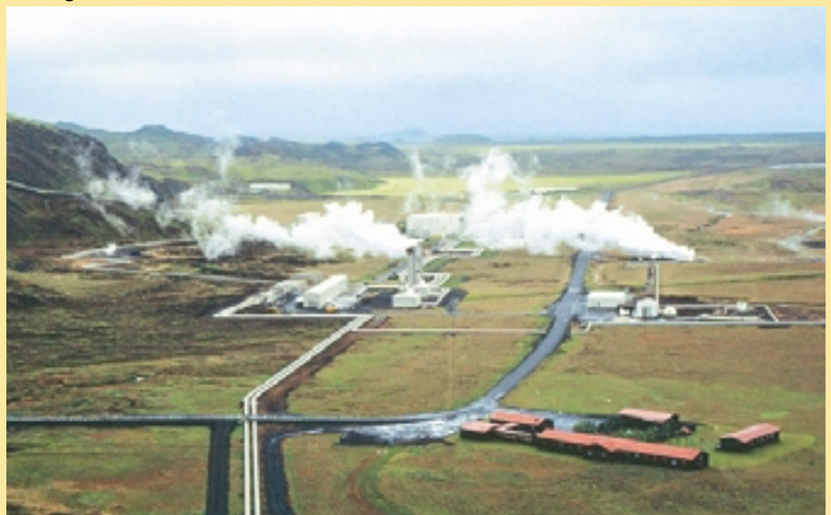
Planta geotérmica en Islandia

El Gobierno de la República Federal de Alemania ha invitado a organizaciones de la ONU y otras organizaciones internacionales a participar al más alto nivel posible. El esbozo de programa, la información técnica para los participantes y los formularios de registro han sido enviados a fines de enero de 2004 . Más ejemplares de esos documentos pueden ser solicitados al Secretariado de la Conferencia y en las Embajadas/representaciones permanentes alemanas. Se solicita a las organizaciones participantes que envíen a los organizadores hasta el 30 de abril de 2004 y a través de las Embajadas/representaciones permanentes alemanas una lista con los delegados que participarán en la conferencia. Además se solicita a cada delegado que envíe un formulario de registro a la Oficina de Registro del Secretariado.