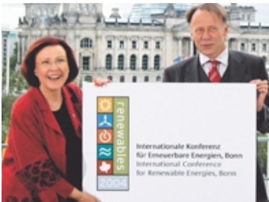
Heidemarie Wieczorek-Zeul y Jürgen Trittin