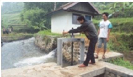
Microgenerador hidráulico en una aldea de Indonesia no conectada a la red eléctrica