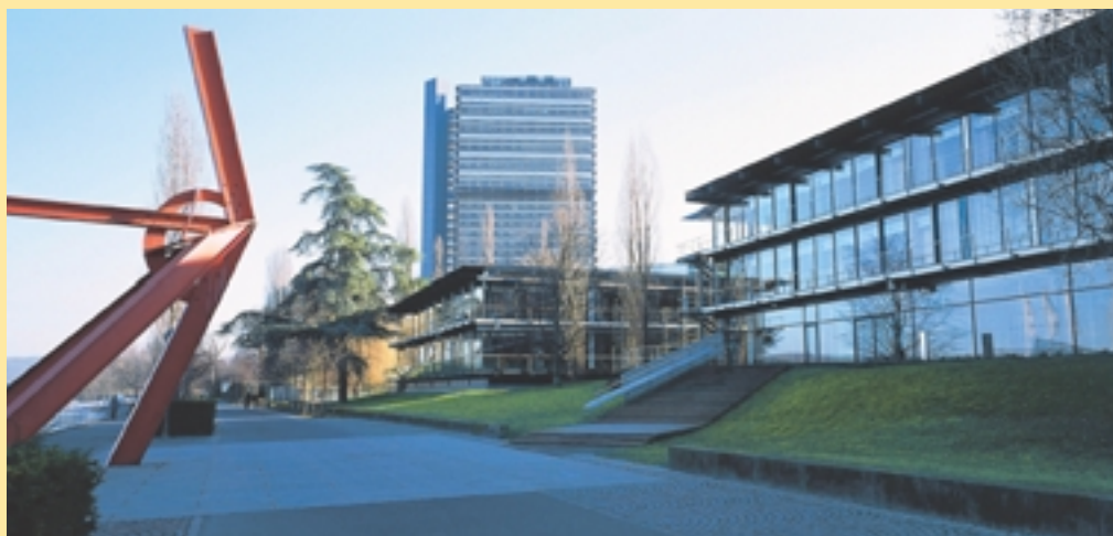
La sede de la conferencia, a orillas del Rin

Los costos de exposición deben ser sufragados por los expositores. Apoyo técnico y otros servicios podrán ser contratados con empresas que el Secretariado de la Conferencia pondrá a disposición. El Secretariado dará a conocer más detalles luego de realizada la selección.