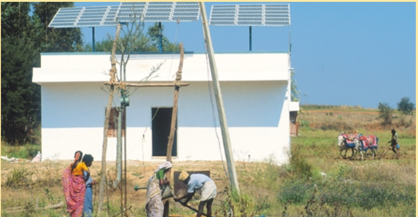
Paneles solares sobre el techo de una casa de campesinos en la India proveen energía para una bomba de agua

Los ministros estarán presentes durante dos días (junio 3 y 4). El segmento ministerial será abierto por Gerhard Schröder, el Canciller Federal, y otros oradores de primera línea. En el segmento ministerial confluirán las declaraciones de gobiernos que desempeñan papeles claves en el fomento de las energías renovables y los informes y compromisos de los diferentes segmentos de la conferencia, p. ej. las partes interesadas tendrán la oportunidad de presentar los resultados del diálogo MSD. Los ministros y otros delegados discutirán la propuesta de resultados de la conferencia. Los grupos de trabajo ministeriales, divididos en paneles temáticos, ofrecerán un foro de discusión interactiva, centrado en la búsqueda de soluciones. Esos grupos de trabajo están abiertos a los ministros y otros delegados.