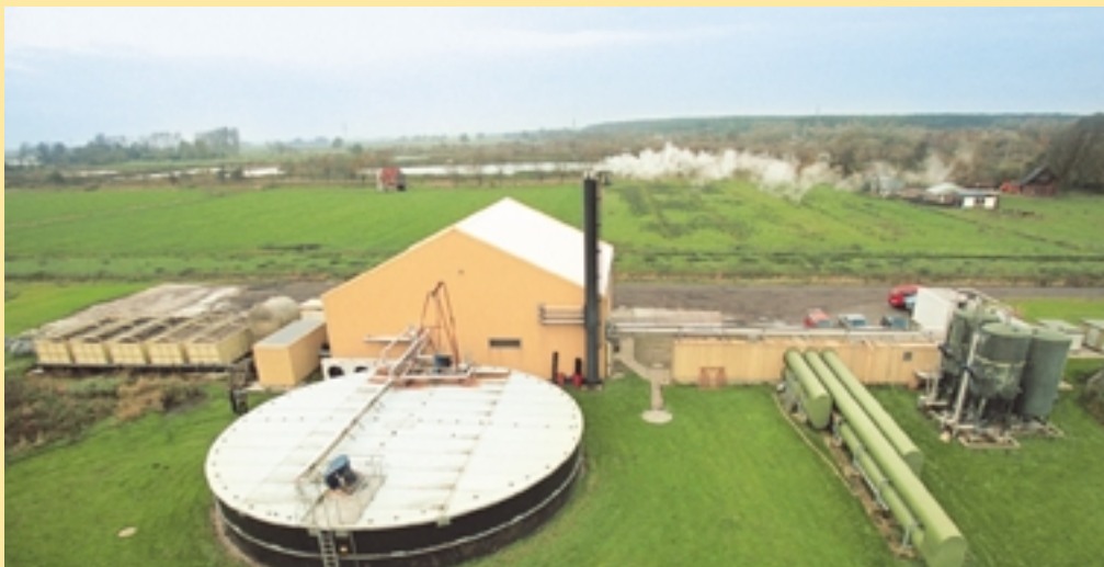
Planta de biogás en Schleswig-Holstein, Alemania

A los delegados a quienes se haya concedido asistencia financiera se les reembolsarán los gastos de viaje contra presentación del billete original de avión para un vuelo entre el aeropuerto más cercano a su hogar y Colonia/Bonn, Düsseldorf o Francfort del Meno. El importe para los gastos diarios personales se les entregará a su arribo a Bonn, en la oficina del Secretariado de la Conferencia.