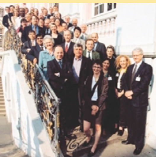
El International Steering Committee

Para asesorar a los organizadores con respecto a los temas, la estructura y los resultados de la conferencia ha sido creado un International Steering Committee (ISC) . El ISC tiene una composición equilibrada, con unos 50 miembros elegidos por regiones y funciones (directivos y altos funcionarios de gobiernos, organizaciones internacionales, la sociedad civil y empresas privadas). Los miembros son invitados individualmente "ad personem" por el Gobierno alemán, como representantes de importantes partes interesadas, tomando en consideración la relevancia de los respectivos grupos políticos y profesionales. Durante los preparativos para la conferencia, el ISC se reúne tres veces en total en Alemania.