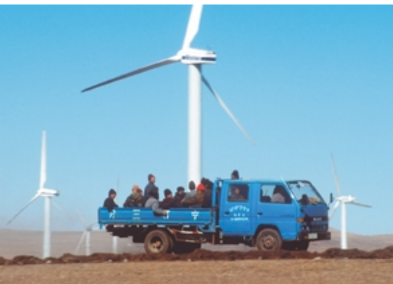
Energía eólica, un recurso natural en Mongolia Interior

Un considerable desarrollo de los respectivos mercados es una condición previa para un substancial aumento en el uso de las energías renovables. Actualmente, sin embargo, las energías renovables no cuentan en todos lados con un marco de políticas favorables al desarrollo de sus potenciales de mercado. Por otro lado, los riesgos relacionados con el uso de energías fósiles no se manifiestan correctamente en señales de mercado. ¿Qué pueden hacer los gobiernos, las organizaciones internacionales y las partes interesadas para desarrollar mejor el mercado y crear igualdad de condiciones para las energías renovables?