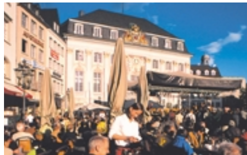
La plaza del mercado, Bonn