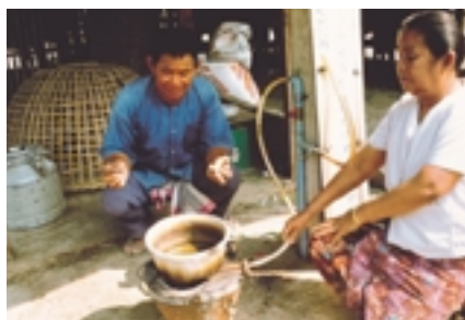
Cocinando en Nepal con gas metano

Para contactar a diferentes grupos de la sociedad civil ha sido designado un International Advisory Group (IAG) . Los miembros del IAG serán los interlocutores durante los preparativos para el MSD de los respectivos grupos de interesados. La composición del IAG refleja toda la gama de actores con intereses, conocimientos y experiencias en el sector de las energías renovables. El IAG propondrá los temas para el MSD y coordinará los aportes de su base constitutiva.