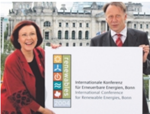
Heidmarie Wieczorek-Zeul und Jürgen Trittin