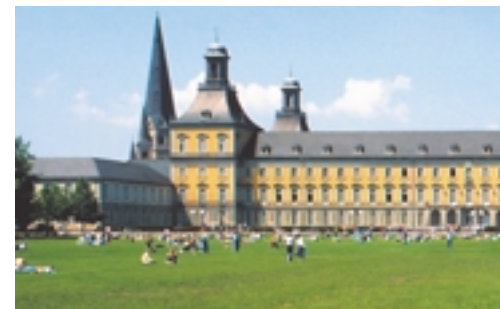
Die Bonner Universität

Als Konferenzstandort hat Bonn seine Leistungsfähigkeit anlässlich mehrerer VN-Vertragsstaatenkonferenzen und großer internationaler Tagungen wie der Internationalen Süßwasserkonferenz im Jahre 2001 unter Beweis gestellt. Räume und Infrastruktur im Internationalen Kongresszentrum Bundeshaus Bonn – direkt an den VN-Campus grenzend – und den umliegenden Konferenzstätten und bald auch in einer weiteren große Plenarhalle mit Annexräumen entsprechen in Bezug auf Qualität und Sicherheit den hohen Anforderungen der Vereinten Nationen.