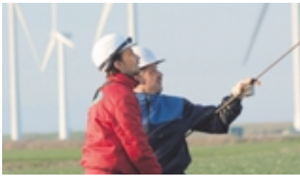
Repowering in Schleswig-Holstein, Deutschland