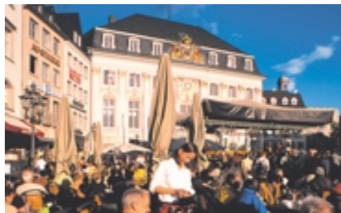
Buntes Treiben auf dem Bonner Marktplatz