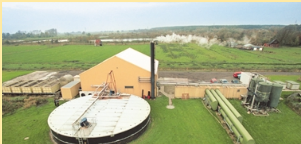
Biogas-Anlage in Schleswig-Holstein, Deutschland

Delegierte, denen finanzielle Unterstützung bewilligt wird, erhalten nach Ankunft in Bonn im Konferenzsekretariat Tagegelder sowie eine Erstattung ihrer Reisekosten gegen Vorlage des Originaltickets von dem ihrem Heimatort nächstgelegenen Flughafen zu den Flughäfen Köln/Bonn, Düsseldorf oder Frankfurt/Main.