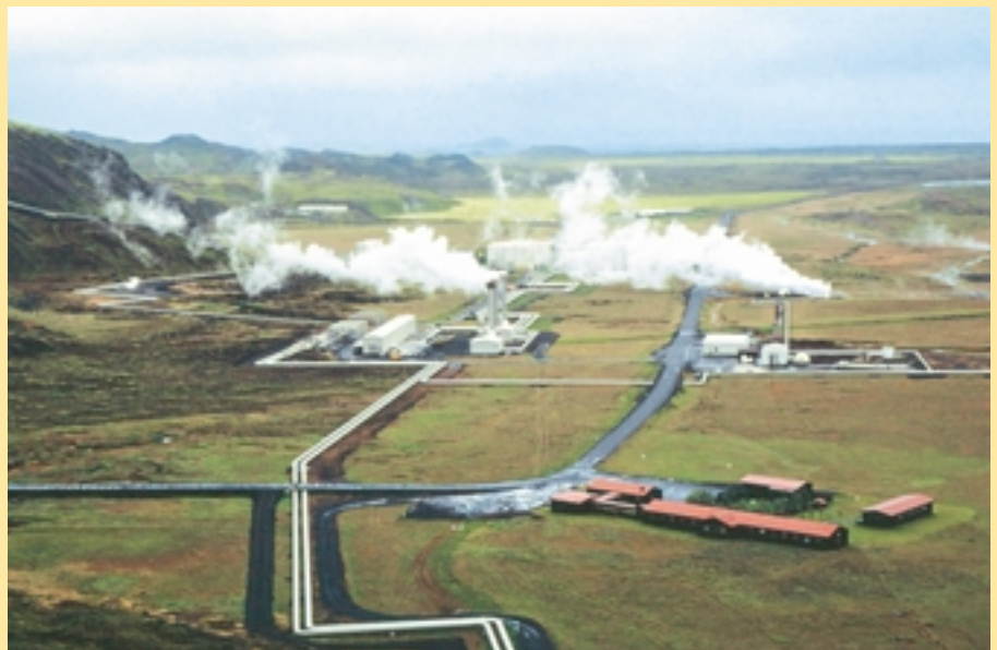
Erdwärmekraftwerk auf Island

Die Regierung der Bundesrepublik Deutschland hat auf höchster Ebene UN-Organisationen und andere internationale Organisationen zur Teilnahme an der Konferenz eingeladen. Der Entwurf des Konferenzprogramms, die technischen Informationen und die Anmeldeformulare sind Ende Januar 2004 versandt worden. Zusätzliche Exemplare können beim Konferenzsekretariat und bei den deutschen Botschaften/ ständigen Vertretungen angefordert werden. Teilnehmende Organisationen werden gebeten, den Konferenzveranstaltern bis zum 30. April 2004 über die deutschen Botschaften/ständigen Vertretungen eine Delegiertenliste zuzuleiten. Zusätzlich wird jeder/jede Delegierte gebeten, ein Anmeldeformular an das Anmeldebüro des Konferenzsekretariats zu schicken.