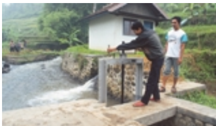
Kleinwasserkraftwerk für ein indonesisches Dorf ohne Versorgungsnetz