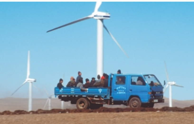
Naturressource Windenergie in der Inneren Mongolei

Die verstärkte Entwicklung entsprechender Märkte ist Voraussetzung für einen deutlichen Zuwachs bei der Nutzung erneuerbarer Energien. Derzeit finden erneuerbare Energien jedoch nicht überall die notwendigen politischen Rahmenbedingungen, um ihre Marktpotenziale voll zu entwickeln, und die Risiken einer Abhängigkeit von fossilen Energiequellen werden nicht angemessen in Marktsignale übersetzt. Was können Regierungen, internationale Organisationen und Interessengruppen für eine bessere Marktentwicklung und die Schaffung fairer Ausgangsbedingungen für erneuerbare Energien tun?