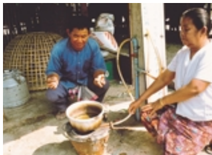
Ein nepalesischer Koch bei der Arbeit mit Methangas

Eine internationale Beratergruppe ( International Advisory Group ) wurde für die Kontakte mit verschiedenen Gruppen der Zivilgesellschaft einberufen. Die Mitglieder der Beratergruppe stehen als zentrale Ansprechpartner für die Vorbereitungen der jeweiligen Interessengruppen auf den MSD zur Verfügung. Die Zusammensetzung der internationalen Beratergruppe spiegelt das Spektrum der Akteure mit Interesse, Fachwissen und Erfahrung im Bereich erneuerbare Energien wider. Beide Geschlechter und verschiedene Regionen sollen gleichberechtigt vertreten sein. Die internationale Beratergruppe wird die Themen für den MSD vorschlagen und die Beiträge der einzelnen Gruppen koordinieren.