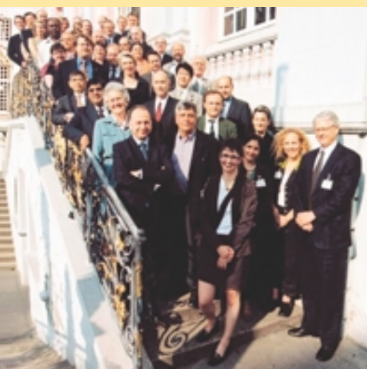
Der Internationale Lenkungsausschuss

Ein Internationaler Lenkungsausschuss (International Steering Committee) wurde einberufen, um die Veranstalter im Hinblick auf Themen, Struktur und angestrebte Ergebnisse der Konferenz zu beraten. Der Internationale Lenkungsausschuss ist nach Regionen und Funktionen (Führungs- und Entscheidungsverantwortliche aus Regierungen, internationale Organisationen, Zivilgesellschaft und Privatwirtschaft) mit rund 50 Mitgliedern ausgewogen besetzt. Die Mitglieder wurden von der Bundesregierung „ad personam“ als Vertreterinnen und Vertreter wichtiger Interessengruppen eingeladen. Dabei wurden die relevanten politischen und fachlichen Kreise angemessen berücksichtigt. Im Vorfeld der Konferenz trifft sich der Internationale Lenkungsausschuss insgesamt dreimal in Deutschland.