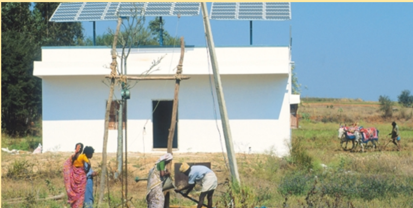
Solarzellen auf einem indischen Farmhaus zum Betrieb einer elektrischen Wasserpumpe

An zwei Tagen (3. – 4. Juni) ist die Teilnahme von Ministerinnen und Ministern vorgesehen. Das Ministersegment wird von Bundeskanzler Gerhard Schröder und anderen prominenten Sprechern eröffnet. Es bietet Raum für Erklärungen von Regierungen, die eine Schlüsselrolle bei der Förderung erneuerbarer Energien spielen, und die Berichte und Verpflichtungen der verschiedenen Konferenzgruppen. Interessengruppen werden die Möglichkeit erhalten, das Ergebnis des Multi-Stakeholder-Dialogs vorzutragen. Minister/innen und andere Delegierte werden die vorgeschlagenen Konferenzergebnisse diskutieren. Themenspezifische ministerielle Arbeitsgruppen werden eine lösungsorientierte Diskussion führen. Sie stehen Minister/innen und anderen Delegierten offen.