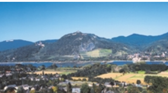
Blick auf das Siebengebirge bei Bonn

Römerlager, mittelalterliches Handelszentrum für die Region, Sitz der Kölner Erzbischöfe, Kultur- und Universitätsstadt: Bonn blickt auf eine lange Geschichte zurück. 50 Jahre als Regierungssitz haben das Ihre dazu getan, Bonn auf seine heutige Verantwortung als Stadt der Vereinten Nationen (VN) und Knotenpunkt für Zukunftsthemen mit VN-Organisationen, sechs Bundesministerien und mehr als 150 Nichtregierungsorganisationen mehr als gut vorzubereiten. Die Entscheidung der Bundesregierung für den Ausbau des Bonner VN-Campus schuf die Basis für die weitere Entwicklung des aufstrebenden, internationalen Fachstandorts für Umwelt, Entwicklung und Gesundheit. Dazu kommt die Präsenz bedeutender Wissenschaftseinrichtungen in der traditionsreichen Universitätsstadt und der unkomplizierte Kontakt zu führenden und forschenden Unternehmen entlang der strukturstarken Rhein-Main-Ruhr-Schiene. Der wirtschaftliche Schwerpunkt in Bonn selbst liegt in den Bereichen Telekommunikation und Dienstleistung.